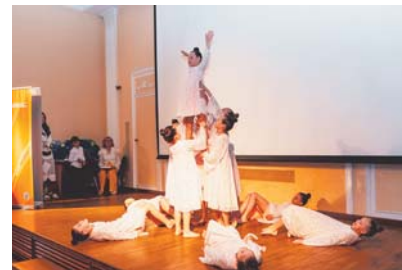
Хореографический ансамбль «Росинка»