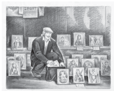
На любой вкус. 1989. Бумага, смешанная техника. 38 x 47