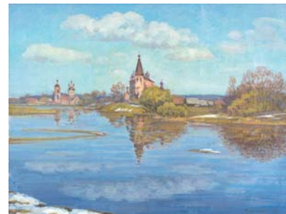
Село Дунилово. Разлив. 2009. Холст, масло. 50 x 65

три картины во все стены — «Брак у Кане Галилейской», «Тайная вечеря» и «Распятие». До этого я видел только маленькие их репродукции. А тут настоящие оригиналы, такой масштаб! Я как встал перед ними и забыл про группу. Так и простоял целый час в этом зале».