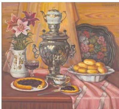
Натюрморт с черничными пирогами. 2013. Холст, масло. 72 x 79