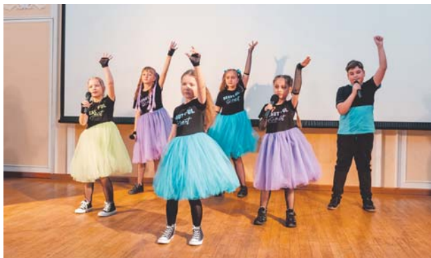
Вокальная студия «Дорогою добра»