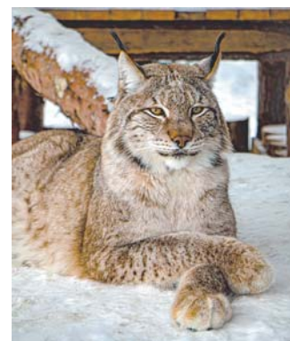
В Ивановском зоопарке живет семья рысей