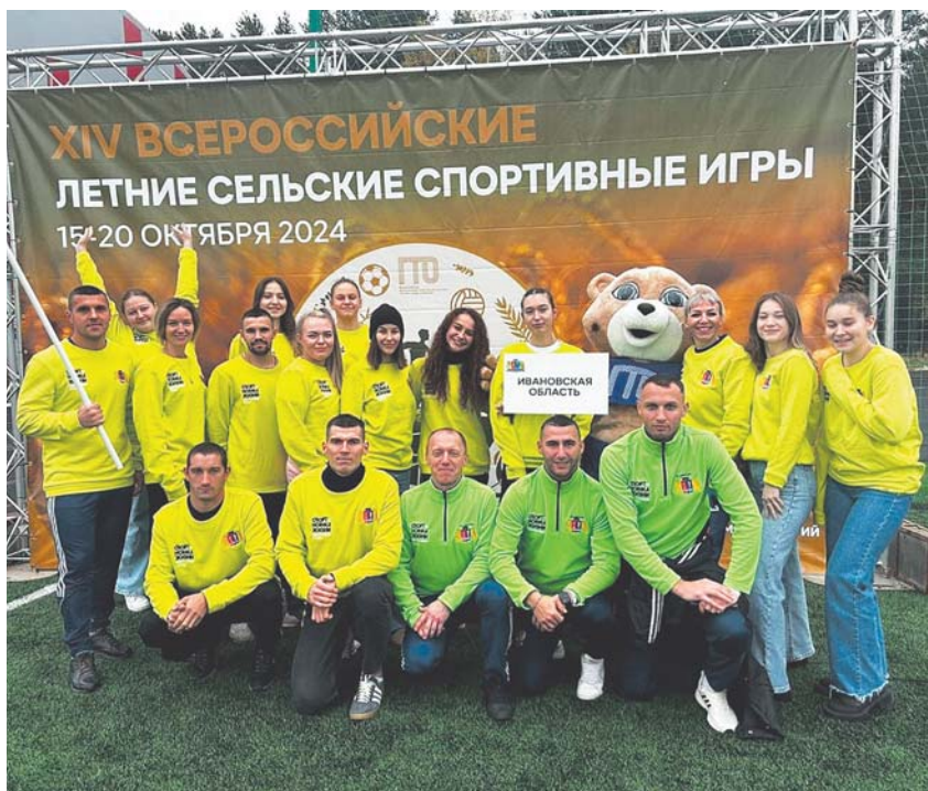
Команда Ивановской области на XIV Всероссийских летних сельских спортивных играх

— В Ивановской области в связи с ее географическим положением традиционно более развито молочное животноводство, а растениеводство в основном служит источником для кормления скота. Самое крупное сельхозпредприятие региона, специализирующееся на молочном скотоводстве, — АО «Племенная завод им. Дзержинского», входит в